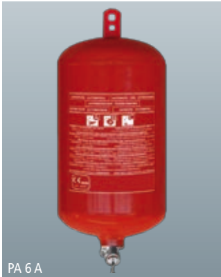
PA 6 A