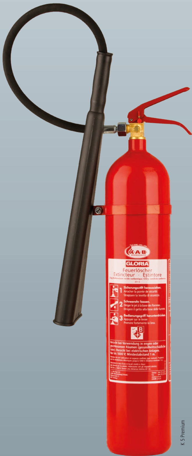
K 5 Premium

Wer schützt Ihre Daten wenn es brennt? Qui protège vos données quand ça brûle ? Chi protegge i Vostri dati in caso di incendio?