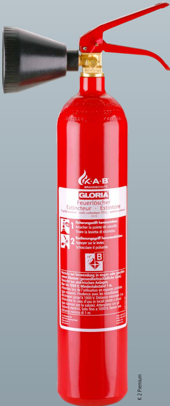
K 2 Premium

Beim Löschen Spuren hinterlassen? Nicht mit mir!