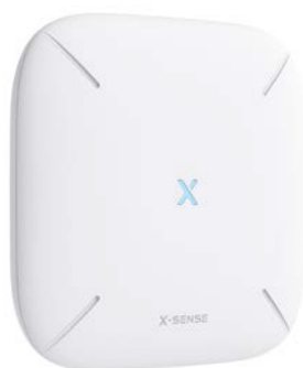
Basisstation SBS50 – Art.-Nr.: 500.057

Zubehör für die Verwendung mehrerer XS01-M mit Vernetzung/Kopplung und Steuerung über WLAN (nur 2.4 Ghz) und X-Sense Home Security-App.