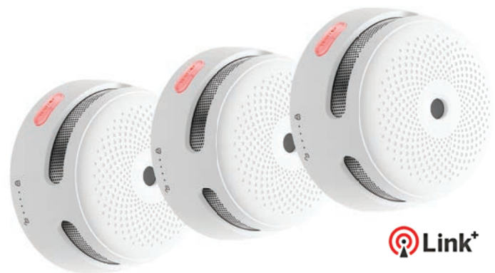
XS01-M Intelligente Rauchmelder

Auf Wunsch mit einer Basisstation auch per App steuerbar.