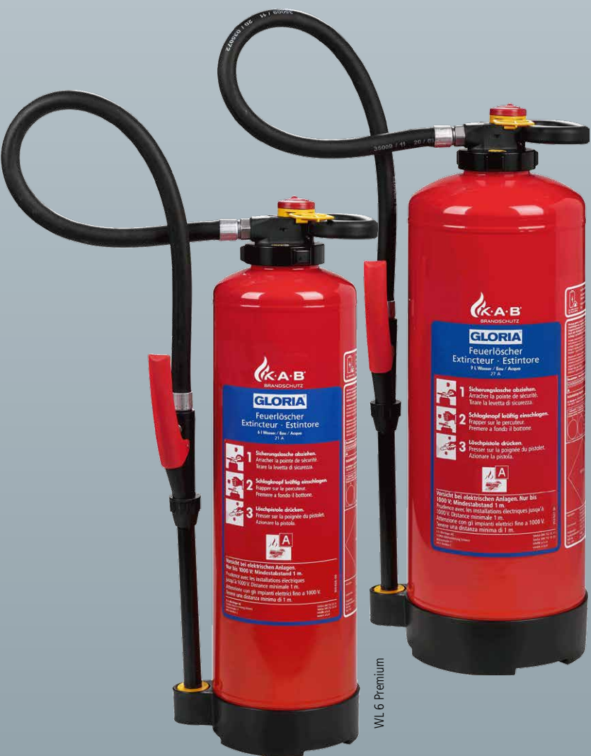
WL 6 Premium